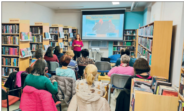
PROMÍTÁNÍ FILMU Himalaya Caravana v rámci akce Most pro Tibet v pobočce Daliborova.

Zveme všechny děti na tvůrčí dílnu. Společně si vyrobíme jedinečnou tašku (nejen) na knížky, inspirovanou naší rozmanitou planetou Zemí.